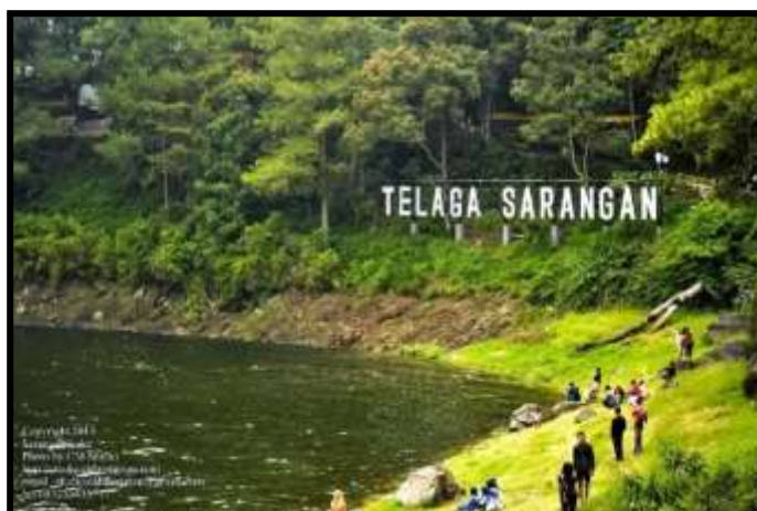
Gambar 2.1 Contoh Media Gambar

Peserta didik dapat mengembangkan topik dengan menggunakan media gambar sebagai fasilitas, seperti contoh berikut ini.