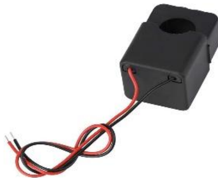
Gambar 2. 4 Sensor PZCT 2 Open-CT

Sensor ini memiliki ketahanan lingkungan yang baik, mampu bekerja pada suhu antara -40^{\circ}\text{C} hingga +85^{\circ}\text{C} , frekuensi operasi 50-60 Hz, serta isolasi tegangan yang kuat dan tahan terhadap kelembapan. Dalam jurnal dan aplikasi praktis, PZCT-2 Open CT sering digunakan sebagai sensor arus pada sistem monitoring konsumsi listrik berbasis mikrokontroler atau IoT , di mana data arus yang diukur kemudian diolah untuk memantau penggunaan daya listrik secara real-time . Adapun hardware sensor PZCT 2 Open CT dapat dilihat pada Gambar 2.4 berikut :