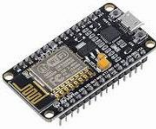
Gambar 2. 7 ESP8266

Dari sisi spesifikasi teknis, ESP8266 bekerja pada tegangan operasi antara 3,3 volt hingga 5 volt, dengan konsumsi daya yang relatif rendah, yaitu berkisar antara 10 \mu A hingga 170 mA, sehingga cocok digunakan pada sistem hemat energi atau perangkat yang ditenagai oleh baterai. Modul ini juga didukung oleh prosesor dengan kecepatan clock antara 80 MHz hingga 160 MHz, yang memberikan kinerja komputasi cukup tinggi untuk kebutuhan pengolahan data secara real-time. Kapasitas memorinya terdiri dari 32 KB Instruction RAM dan 80 KB Data RAM, yang memadai untuk menjalankan berbagai skenario pemrograman ringan hingga menengah. Selain itu, keberadaan flash memory hingga 16 MB memberikan keleluasaan dalam menyimpan skrip program maupun data konfigurasi sistem. Kombinasi spesifikasi tersebut menjadikan NodeMCU ESP8266 versi 1.0 lebih efisien dan kompeten dibandingkan versi sebelumnya, baik dari segi performa, efisiensi daya, maupun kemudahan integrasi dengan platform IoT seperti Blynk , Thingspeak , atau MQTT .( Dewi, Nurul Hidayati Lusinta dkk., 2018). Adapun hardware ESP8266 dapat dilihat pada gambar 2.7 berikut ini :