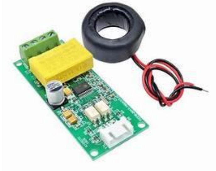
Gambar 2. 1 Sensor PZEM004 T

dengan kecepatan baudrate 9600 bit data, 1 bit stop tanpa paritas. Dalam sistem ini, terdapat beberapa kode fungsi yang digunakan untuk mendeteksi bit data. Kode fungsi tersebut adalah 0x003 untuk membaca register yang ditahan, 0x04 untuk membaca register input, 0x06 untuk menulis register tunggal, 0x04 untuk kalibrasi, dan 0x42 untuk mereset energi. Namun, kode fungsi 0x41 hanya digunakan secara internal dengan alamat 0xF8. Kode ini digunakan untuk kalibrasi pabrik dan kembali ke acara pemeliharaan pabrik. Setelah menggunakan kode fungsi untuk meningkatkan kata sandi 16-bit, kata sandi default adalah 0x3721. Kisaran alamat budak yang digunakan adalah 0x01 hingga 0xF7. Alamat 0x00 digunakan sebagai alamat broadcast, sehingga slave tidak perlu membalas master. Sedangkan alamat 0xF8 digunakan sebagai alamat umum yang dapat digunakan di lingkungan budak tunggal dan untuk operasi kalibrasi. ( Antara A.S.A, I.W.A. Suteja, 2021). Adapun hardware sensor PZEM-0004T dapat dilihat pada gambar berikut :