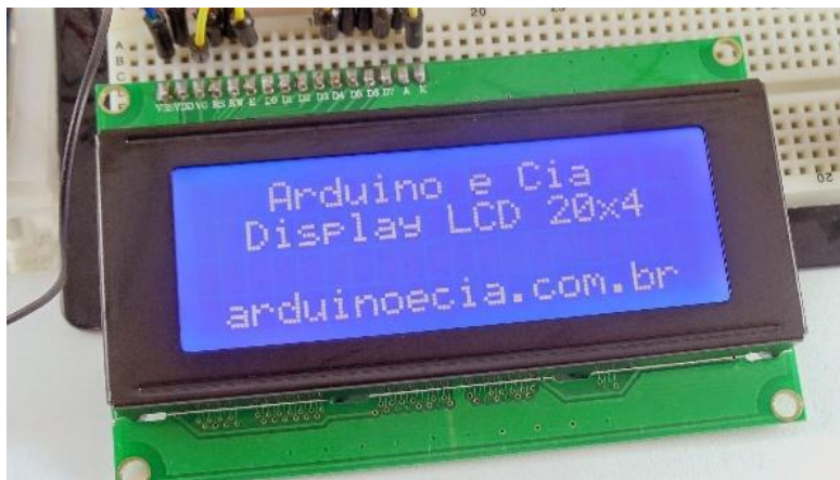
Gambar 2. 2 LCD 20x4

LCD ( Liquid Crystal Display ) merupakan suatu tampilan dari bahan cairan kristal yang pengoperasiannya menggunakan sistem dot matriks. LCD yang digunakan adalah LCD berukuran 20x4 karakter dengan tambahan chip module I2C untuk mempermudah programmer nantinya dalam mengakses LCD tersebut. Sebab dengan digunakannya modul I2C akan lebih menghemat penggunaan pin arduino yang akan digunakan, dengan menggunakan modul I2C maka hanya diperlukan 4 buah pin arduino, yaitu pin SCL, pin SDA, pin VCC dan pin GND. ( Handy Wicaksono, 1996). LCD sudah digunakan diberbagai bidang misalnya alat-alat elektronik seperti televisi, kalkulator, ataupun layar komputer. Adapun hardware LCD 16x2 I2C dapat dilihat pada gambar 2.2 berikut :