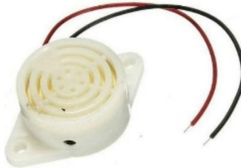
Gambar 2. 3 Buzzer

Buzzer merupakan komponen elektronik yang termasuk dalam kategori transduser, berfungsi mengubah sinyal listrik menjadi gelombang suara. Komponen ini umumnya digunakan sebagai perangkat alarm atau indikator suara pada berbagai sistem elektronik, seperti bel rumah, alarm peringatan, dan sistem keamanan. Mekanisme kerja buzzer didasarkan pada prinsip getaran elektromagnetik yang menghasilkan frekuensi suara tertentu. Selain itu, keunggulan dalam menghasilkan suara menjadikan buzzer sangat penting dalam aplikasi teknologi modern.. Adapun buzzer dapat dilihat pada gambar 2.3 berikut :