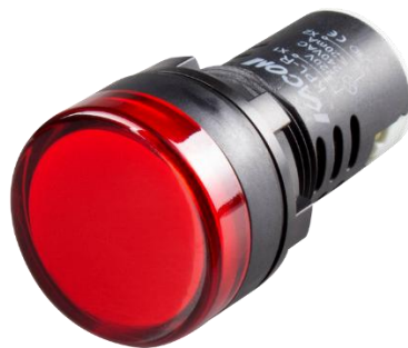
Gambar 2. 5 Pilot Lamp

Dari penjelasan di atas dapat ditarik kesimpulan bahwa pilot lamp adalah indikator visual yang sangat berguna dalam berbagai aplikasi industri dan kelistrikan, membantu meningkatkan keamanan sistem dengan memberikan informasi status listrik secara langsung dan mudah dipahami. Berikut adalah gambar dari pilot lamp :