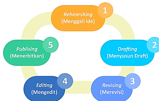
Gambar 2.3 Siklus Menulis

Peserta didik harus mendapatkan tanggapan tentang tulisan mereka dari audiens (kelompok pembaca) yang mereka targetkan. Dengan demikian, peserta didik akan belajar bahwa menulis adalah proses yang melibatkan penciptaan efek (respon) bagi pembaca. Maksudnya, penulis dengan sengaja menciptakan bagian tulisan lucu yang akan membuat pembaca tertawa atau bagian tertentu yang memantik rasa ingin tahu pembaca.