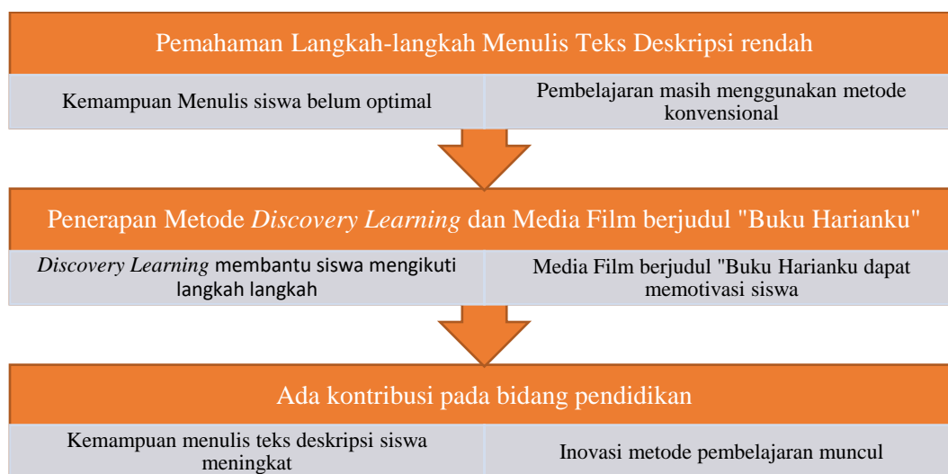
Tabel 2.1 Kerangka Berpikir Menulis Teks Deskripsi

Berikut bagan kerangka berpikir yang lebih detail: