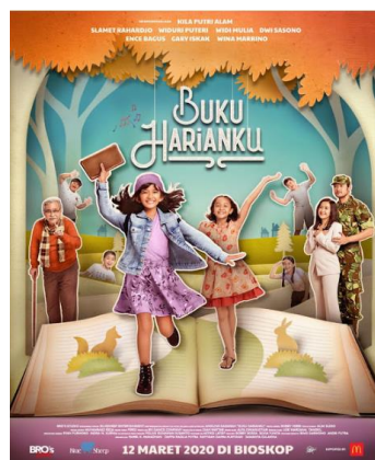
Gambar 2.2 Poster Film “Buku

“Buku Harianku” adalah film yang menyentuh hati dan menginspirasi. Film ini mengajarkan kita tentang pentingnya menghargai diri sendiri, bersyukur atas apa yang kita miliki, dan membangun hubungan yang baik dengan orang-orang di sekitar kita. Film ini cocok untuk penguatan karakter anak-anak maupun orang dewasa.