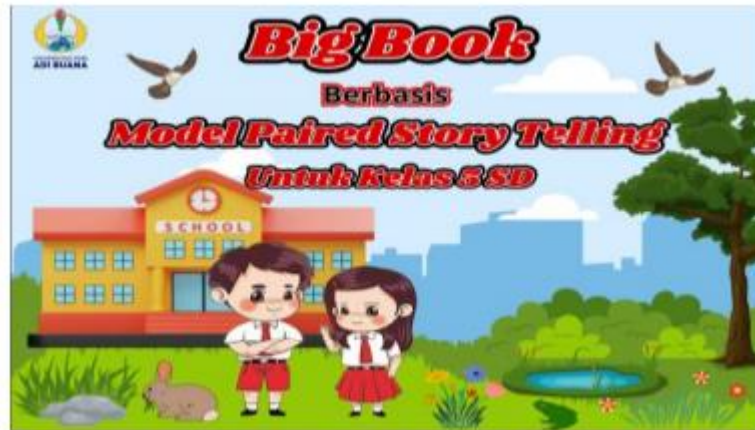
Gambar 2.1 Contoh Big Book

Big Book adalah buku cerita dengan fitur khusus, diperluas dengan teks dan gambar untuk mendorong aktivitas membaca bersama antara guru dan siswa. Big Book atau buku besar adalah jenis buku bacaan yang memiliki ukuran, huruf, dan gambar yang besar, ukurannya bervariasi, mulai dari A3, A4, A5, hingga ukuran yang lebih besar, dengan mempertimbangkan keterbacaan oleh seluruh murid di kelas (Ramadhan & Khairunnisa, 2021).