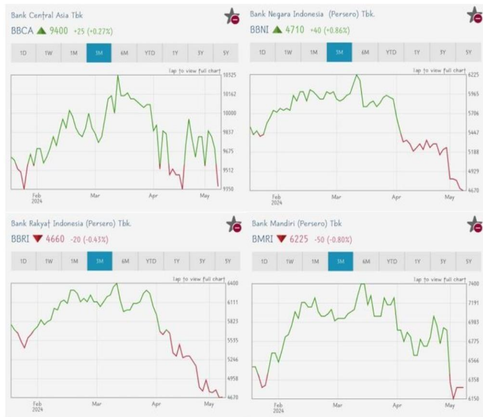
Gambar 1. 2 Grafik Harga Saham Bank Besar di Indonesia