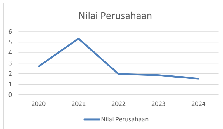
Gambar 1.1 Perkembangan PBV

Terdapat beberapa cara dalam menilai nilai perusahaan, antara lain melalui PBV, Tobin's Q, PER, serta volatilitas harga saham (Putri, 2020; Ningrum, 2022). Rasio PBV sendiri digunakan untuk melihat perbedaan antara harga pasar saham dengan nilai buku per lembar saham. Indikator ini bermanfaat untuk menentukan apakah harga saham suatu perusahaan berada pada kondisi overvalued atau undervalued dibandingkan dengan nilai ekuitasnya (Nurvita, 2022). Berikut ini adalah data mengenai perkembangan nilai perusahaan pada perbankan di Indonesia yang terdaftar di BEI tahun 2020–2024.