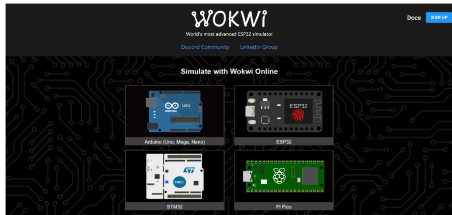
Gambar 2. 1 Platform Wokwi