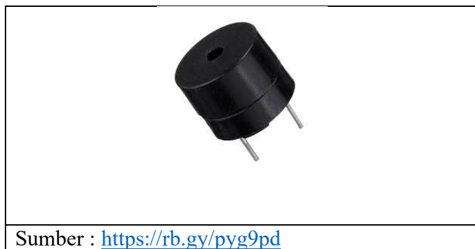
Gambar 2. 5 Buzzer

Buzzer adalah alat yang mengubah getaran listrik menjadi sebuah suara. Cara kerja dari buzzer yaitu hampir sama dengan loud speaker, terdiri dari kumparan yang dipasang di bagian diafragma lalu dialiri oleh arus listrik sehingga dapat dikatakan elektromagnetis, buzzer sendiri biasanya digunakan untuk indicator sebuah proses yang sudah selesai dan indicator abnormal (Saputra et al., 2020). Adapun hardware buzzer dapat dilihat pada Gambar 2.5.