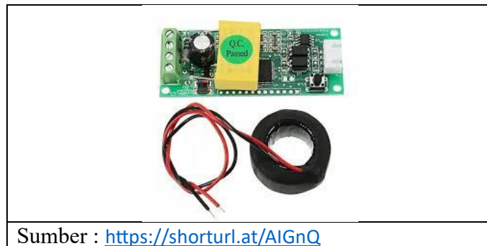
Gambar 2. 2 Sensor PZEM-004T

pengukur tegangan AC, arus, daya aktif, frekuensi dan masih banyak lagi fungsi dari sensor ini (Anwar et al., 2019). Adapun hardware sensor pzem-004t dapat dilihat pada Gambar 2.2.