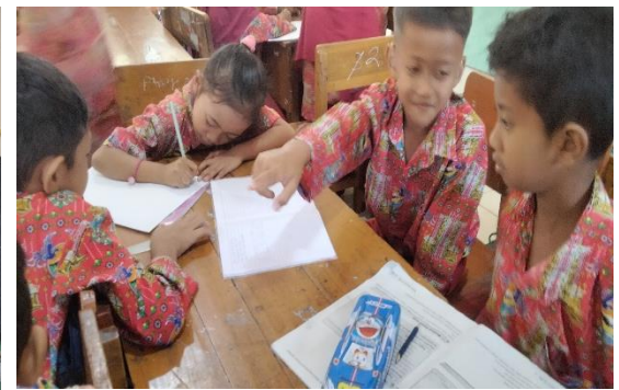
Penyusunan Jadwal Proyek