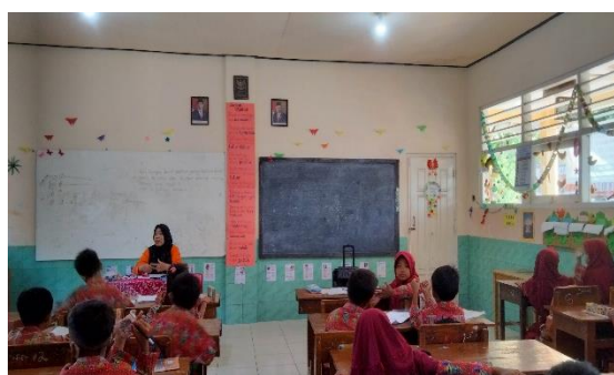
Evaluasi dan Refleksi