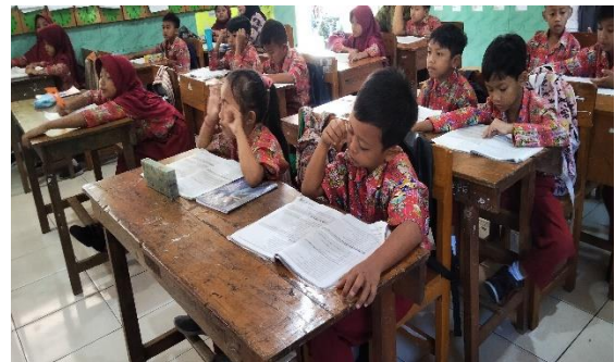
Mendesain Perencanaan Proyek