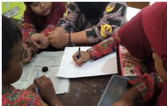
Pelaksanaan dan Monitoring Proyek