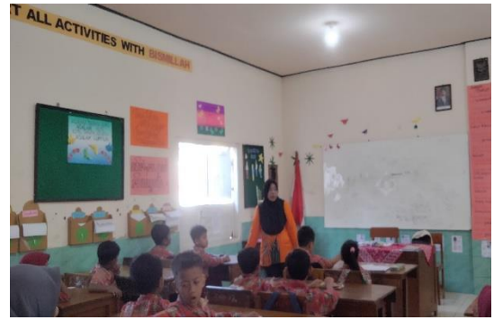
Pengenalan Masalah (Pertanyaan)