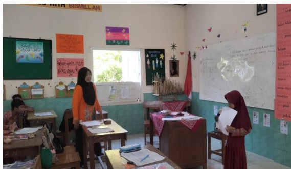
Menguji Hasil (Presentasi Proyek)