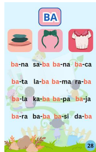
Tampilan Jilid 2