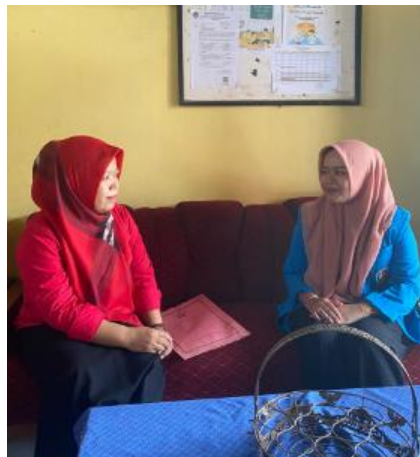
Perizinan Penelitian dengan Kepala Sekolah