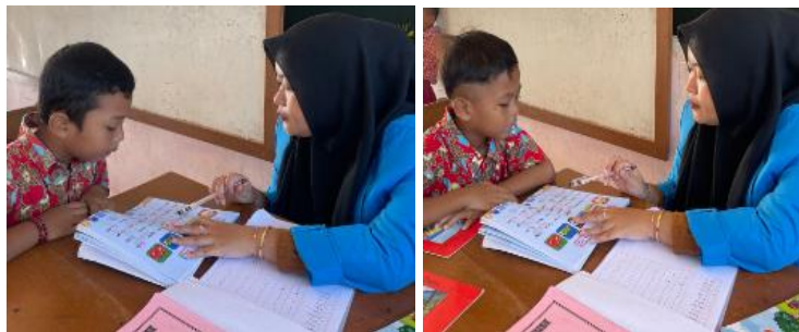
Tes Unjuk Kerja Membaca Permulaan Siswa Kelas I