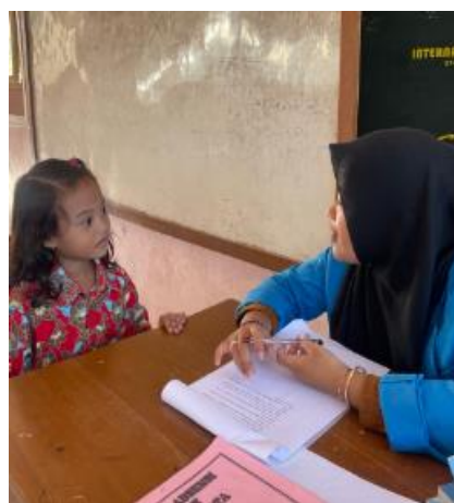
Wawancara dengan Siswa Kelas I