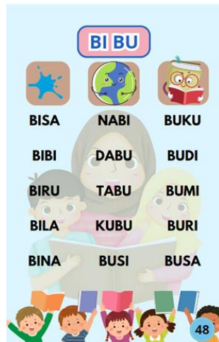
Tampilan Jilid 3