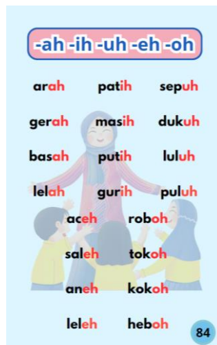
Tampilan Jilid 5