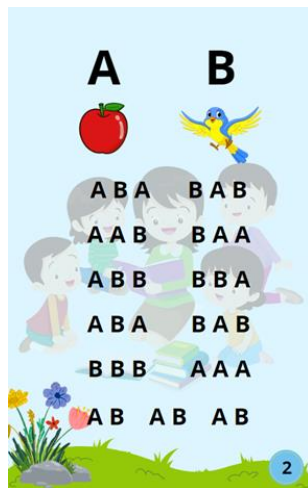
Tampilan Jilid 1