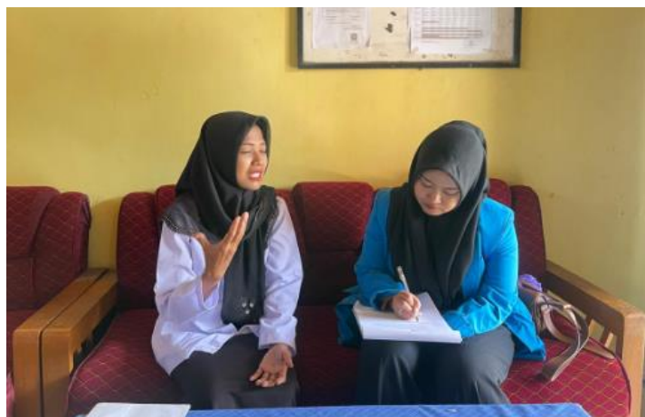
Wawancara dengan Guru Kelas I