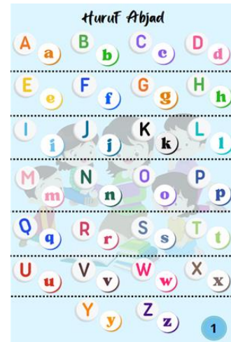
Tampilan Pengenalan Huruf