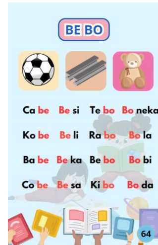
Tampilan Jilid 4