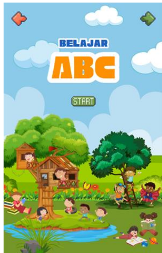
Sampul Bahan Ajar ABC