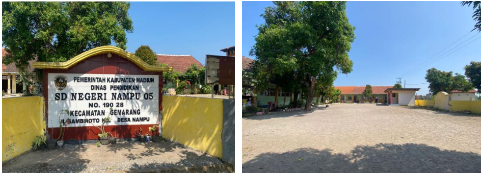
Kondisi Lokasi Penelitian (SDN Nampu 05)