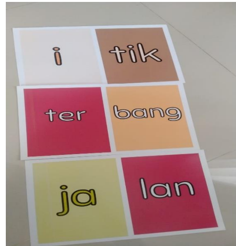
Gambar 2.1 Media Pengenalan Kata