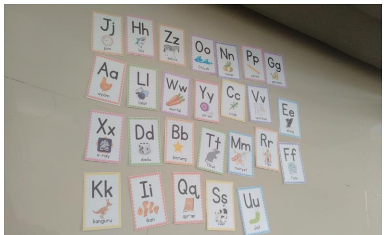
Gambar Flash Card Huruf