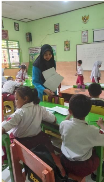
Gambar 9. membagikan soal posttest