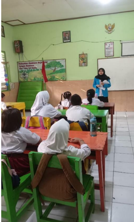
Gambar 1. Salam dan Penyampaian Tujuan Pembelajaran