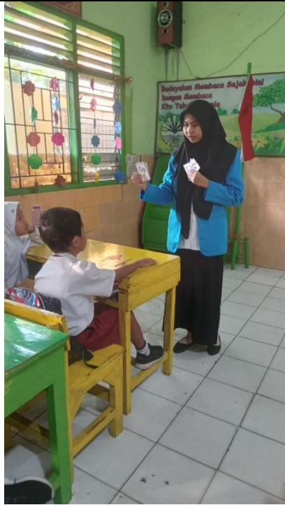
Gambar 5. pengenalan media flash card