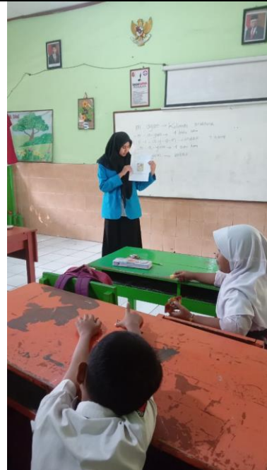
Gambar 6. Membacakan dongeng kepada siswa