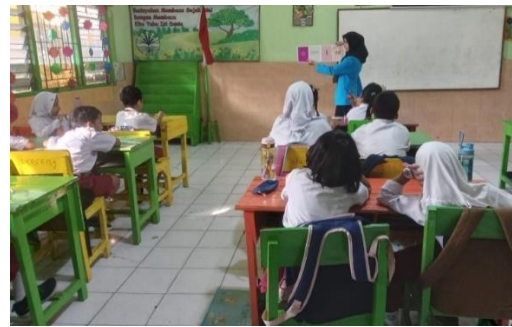
Gambar 8. Pengenalan kalimat