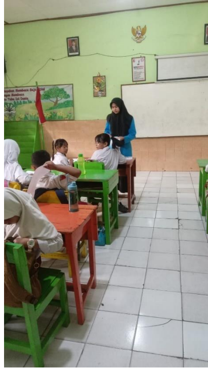
Gambar 2. Membagikan Soal Pretest