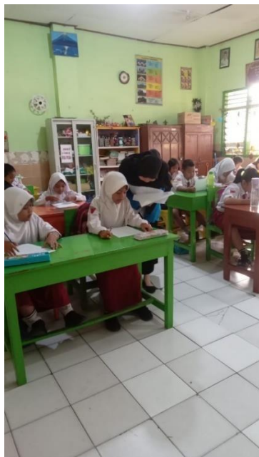
Gambar 3. penilaian pretest