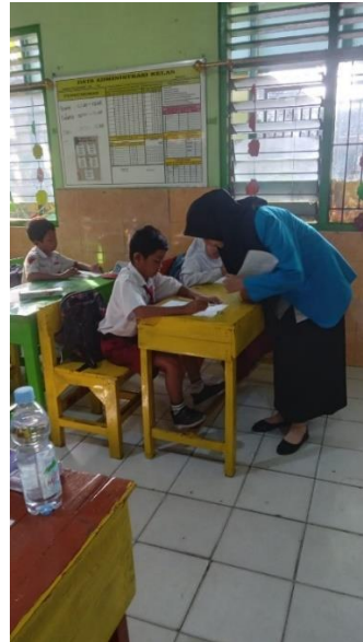
Gambar 10. Penilaian Posttest siswa