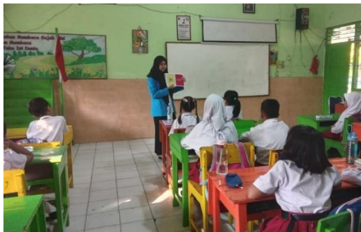
Gambar 7. Pengenalan kata