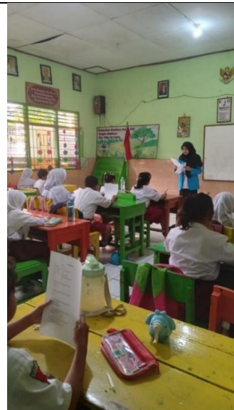
Gambar 4. membaca soal pretest