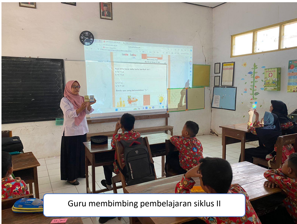
Guru membimbing pembelajaran siklus II