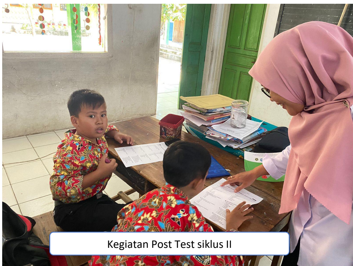
Kegiatan Post Test siklus II