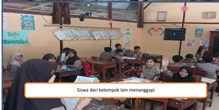
Siswa dari kelompok lain menanggapi