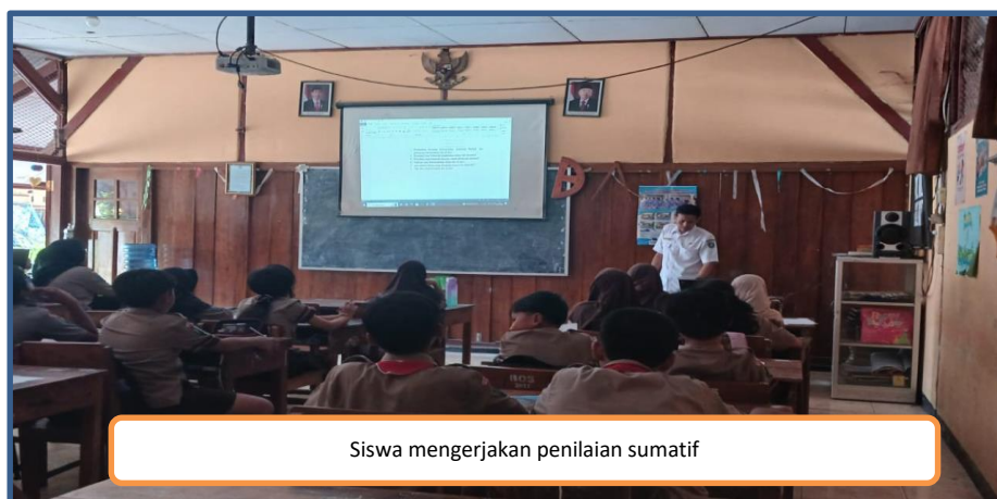
Siswa mengerjakan penilaian sumatif