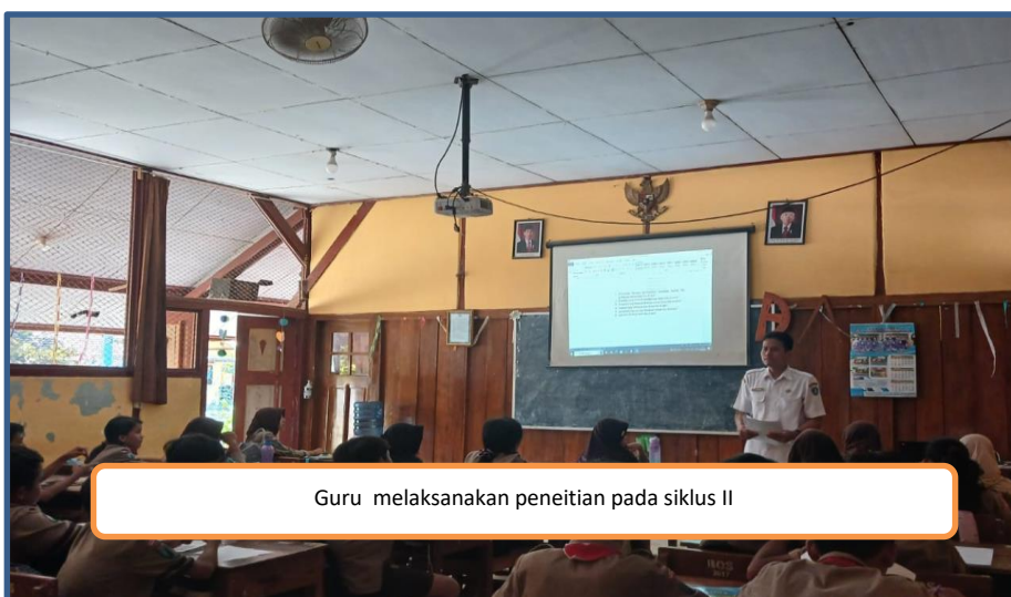
Guru melaksanakan penelitian pada siklus II