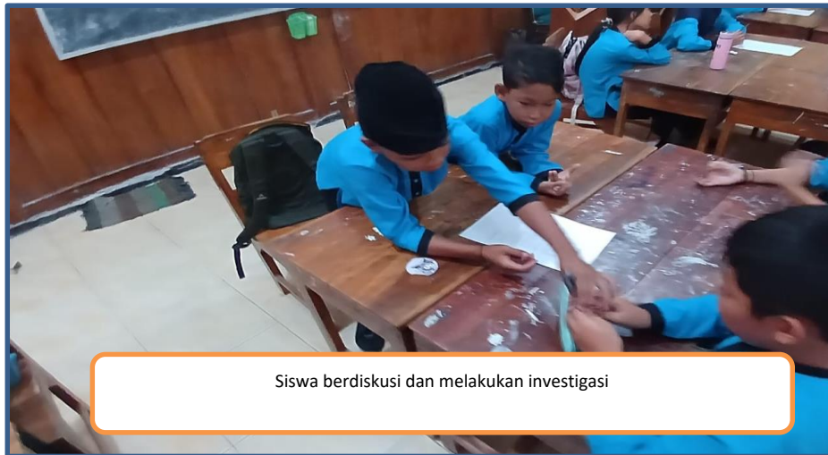
Siswa berdiskusi dan melakukan investigasi