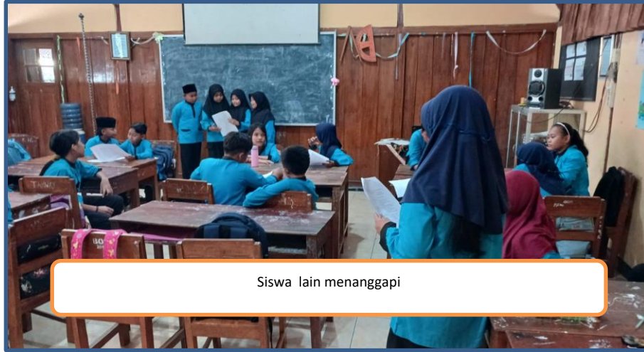
Siswa lain menanggapi