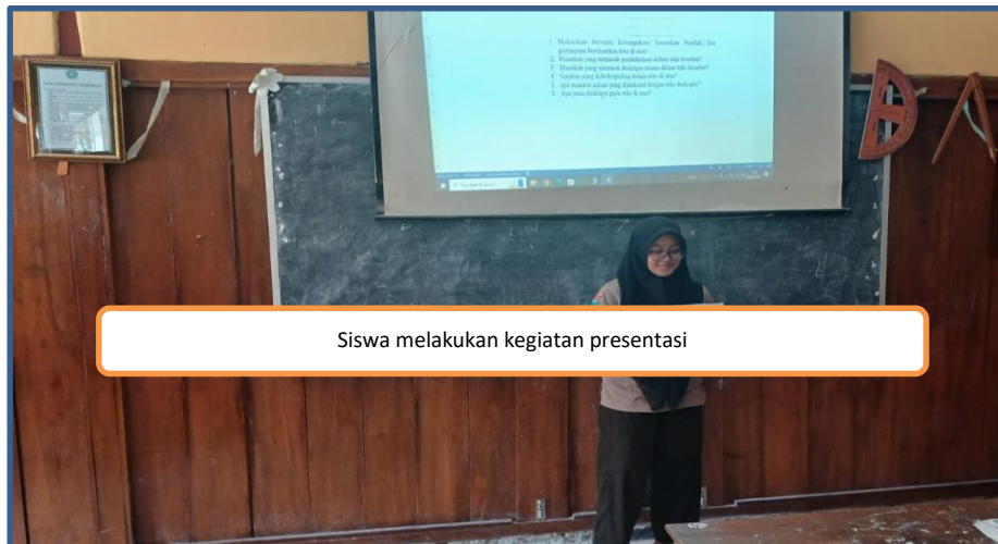
Siswa melakukan kegiatan presentasi