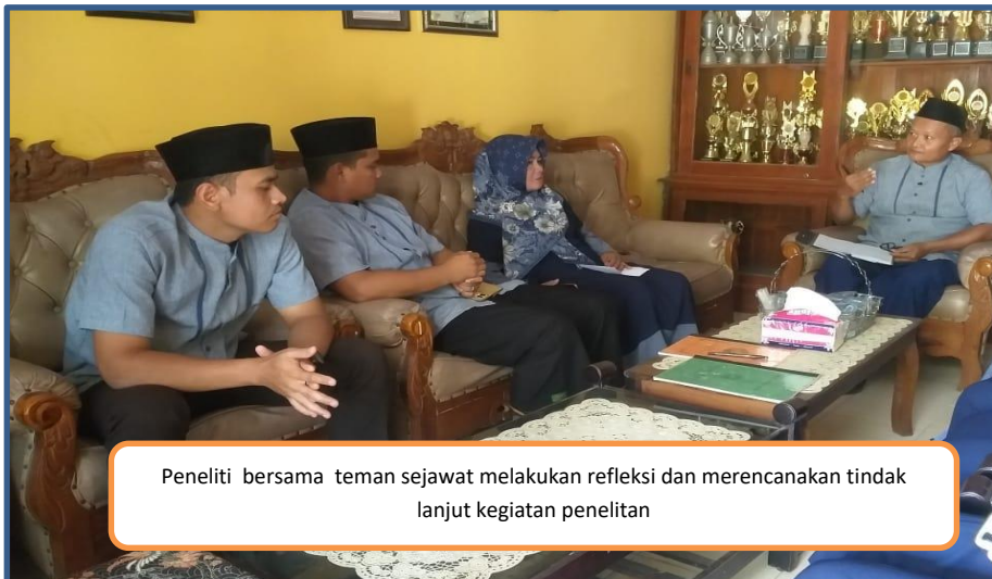
Peneliti bersama teman sejawat melakukan refleksi dan merencanakan tindak lanjut kegiatan penelitian