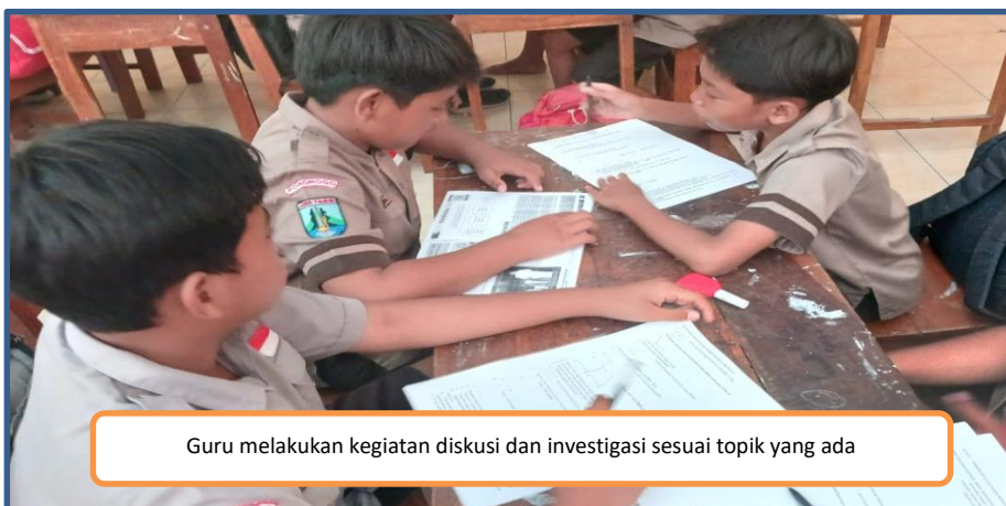
Guru melakukan kegiatan diskusi dan investigasi sesuai topik yang ada