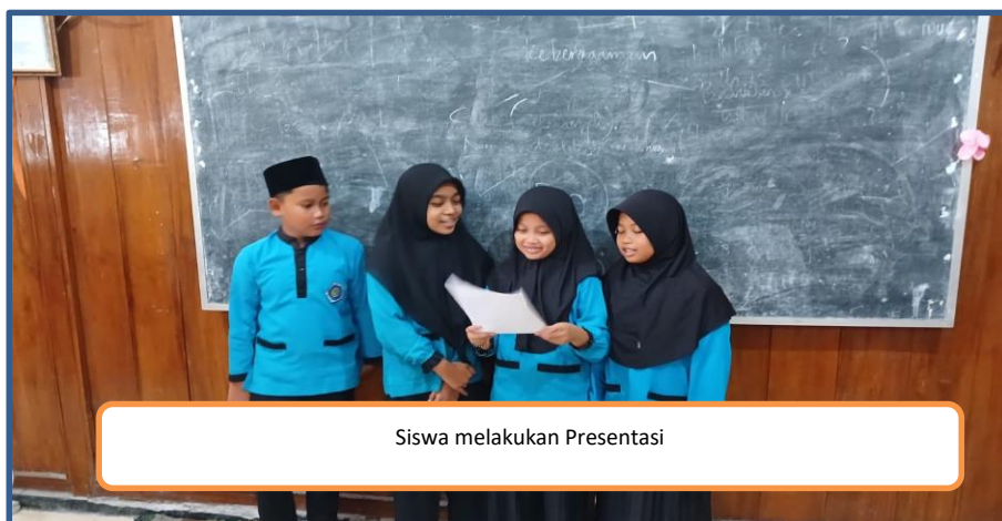
Siswa melakukan Presentasi