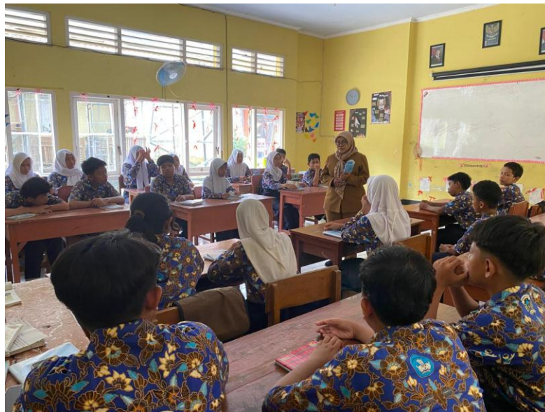
Proses Penguatan Materi