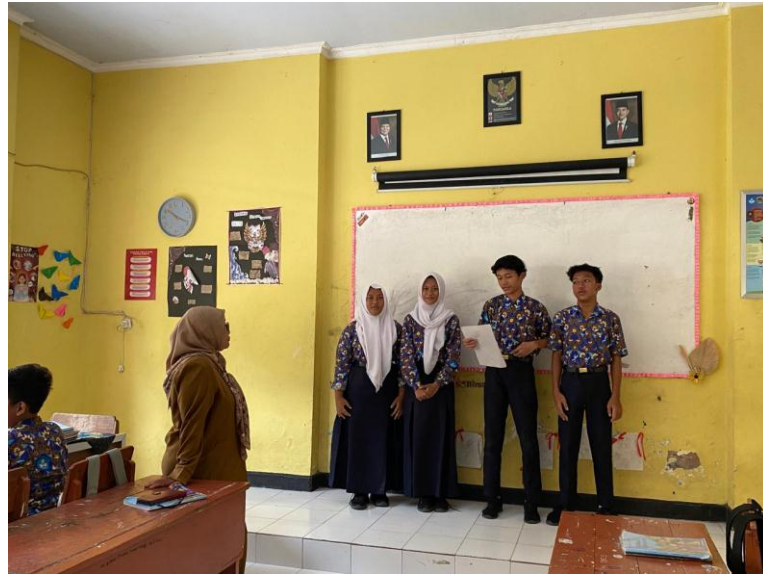
Proses Menyampaikan Hasil Diskusi