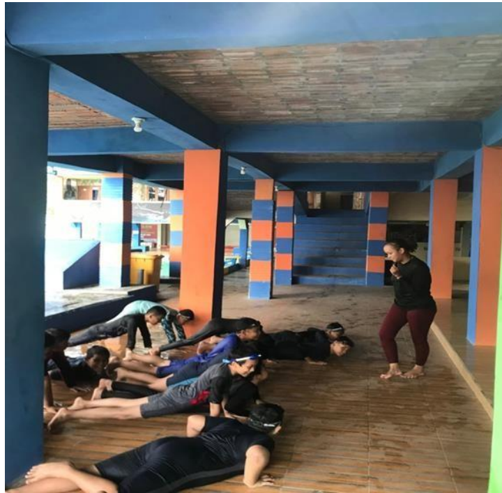
Gambar 5. Dokumentasi atlet tes kekuatan otot lengan ( push up )