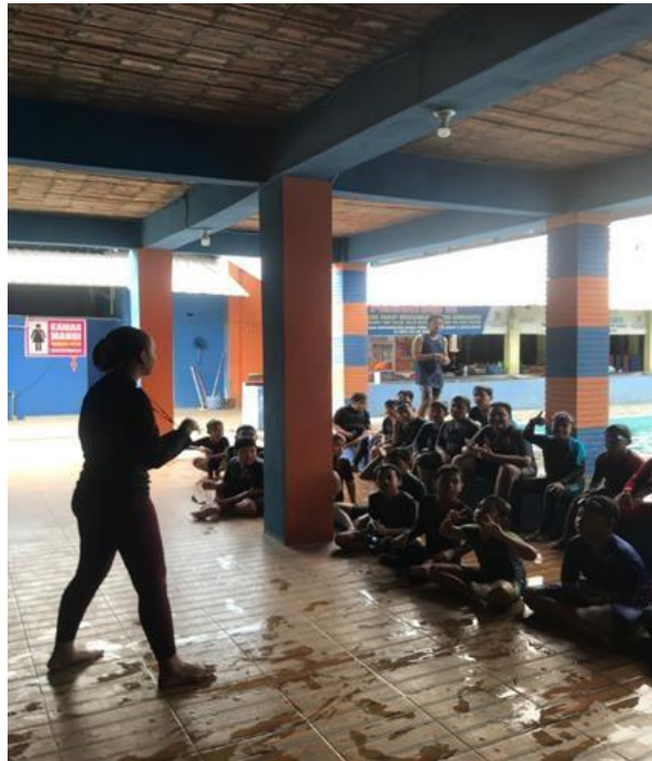
Gambar 1. Pengecekan Data Atlet