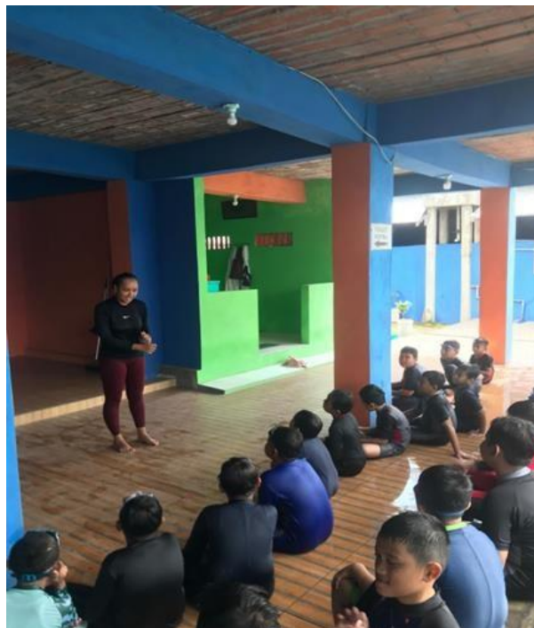
Gambar 2. Persiapan dan Pengecekan Atlet