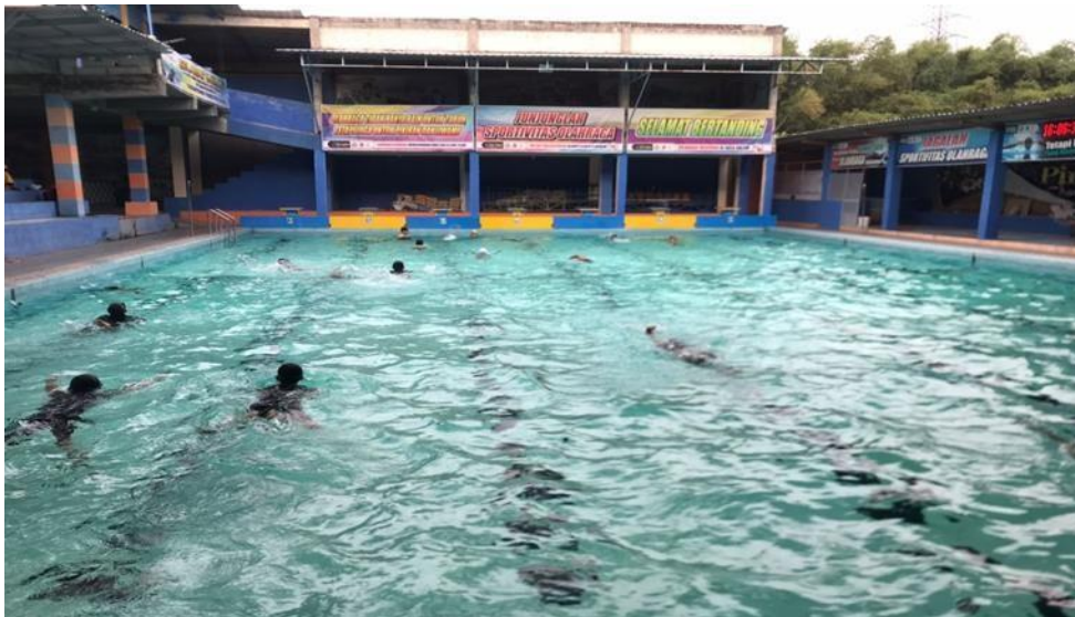
Gambar 6. Dokumentasi Pengambilan Waktu