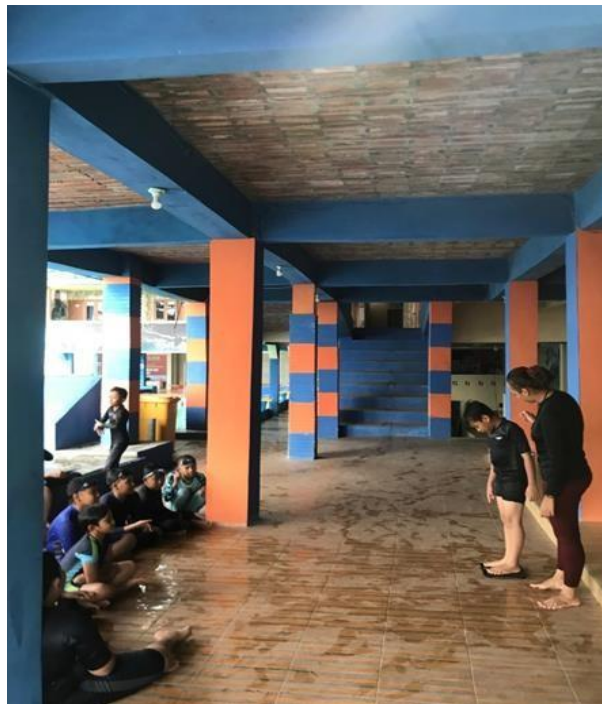
Gambar 4. Dokumentasi atlet timbang berat badan