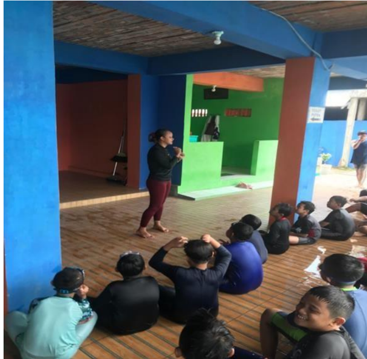
Gambar 3. Pengecekan Data Atlet