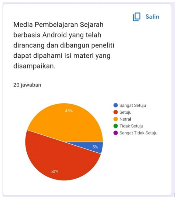
Gambar Lampiran 8 Hasil pertanyaan 4