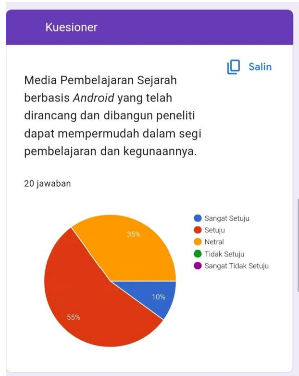
Gambar Lampiran 5 Hasil Pertanyaan 1