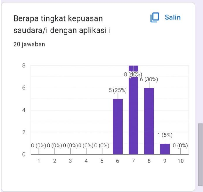
Gambar Lampiran 9 Statistik Dari 20 Jawaban Responden