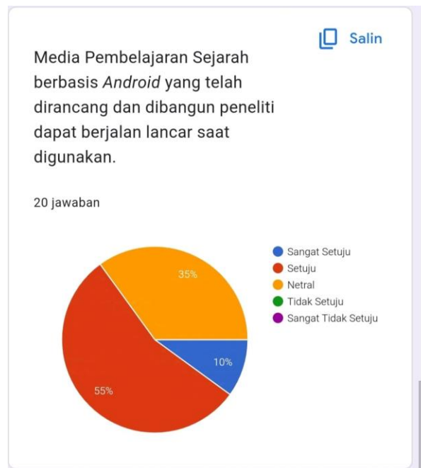
Gambar Lampiran 6 Hasil Pertanyaan 2