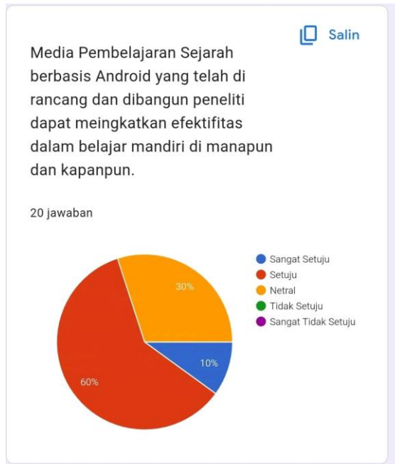
Gambar Lampiran 7 Hasil Pertanyaan 3