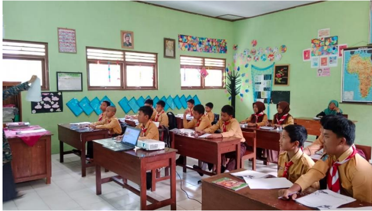
FOTO KEGIATAN SIKLUS I