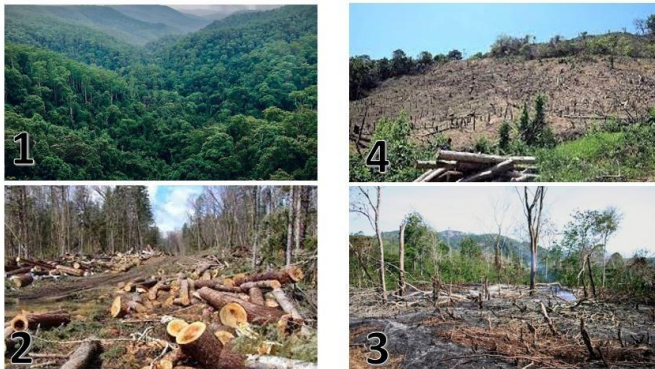
Cermati 4 gambar tersebut kemudian berikan argumentasi atau tanggapan terhadap gambar tersebut!

Sedangkan menurut sisi lautan, posisi Asia Tenggara berada tepat di tengah-tengah antara Samudera Hindia dengan Samudera Pasifik. Apabila dilihat menurut posisi astronomisnya, maka Asia Tenggara berada pada 29,1° LU - 11° LS dan 92° BT - 141° BT.