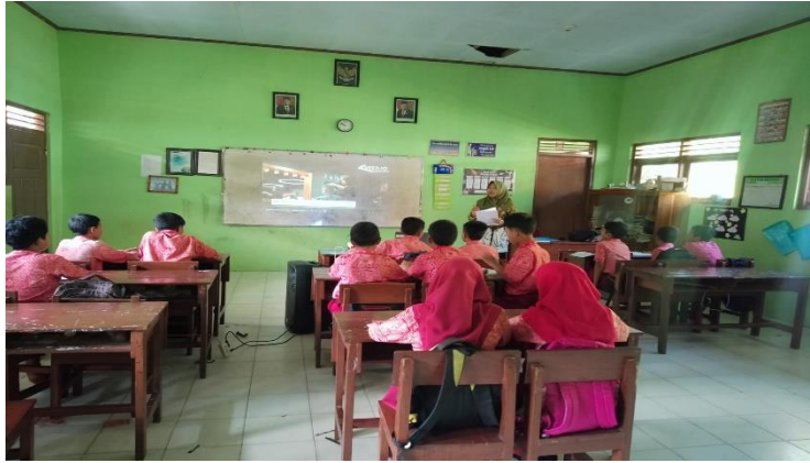
FOTO KEGIATAN SIKLUS 2