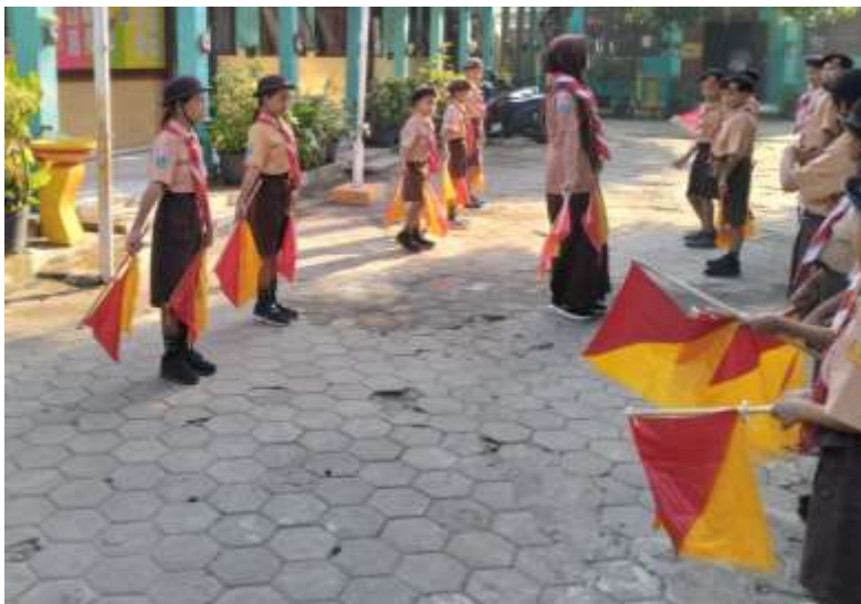
Kegiatan dengan metode belajar sambil melakukan