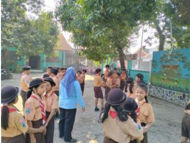
Kegiatan dengan metode kegiatan menarik dan menantang