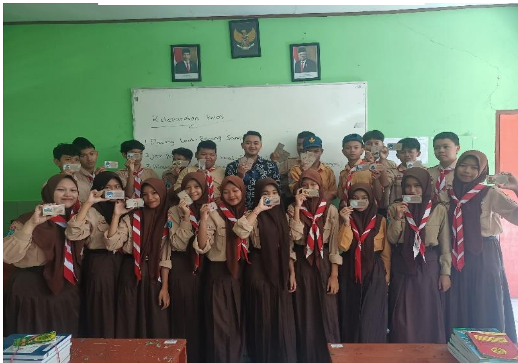
Gambar 4. Foto Bersama kelas VIII C Setelah Pembelajaran Menggunakan Media Kartu Pintar di SMPN 2 Geger Madiun