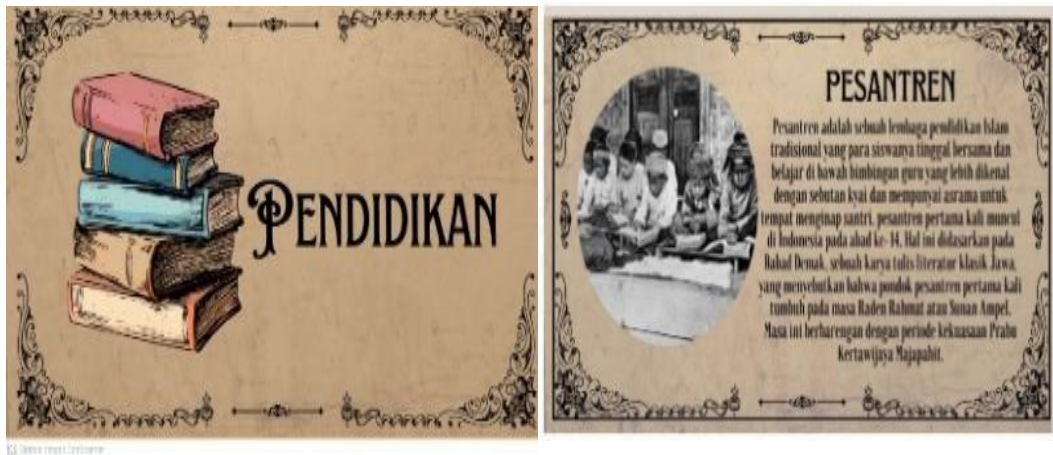
Gambar 5. Gambar ilustrasi pembelajaran Media Kartu Pintar IPS Sejarah yang diterapkan di SMPN 2 Geger Madiun