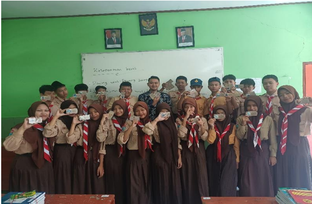
Gambar 3. Foto Bersama kelas VIII B Setelah Pembelajaran Menggunakan Media Kartu Pintar di SMPN 2 Geger Madiun