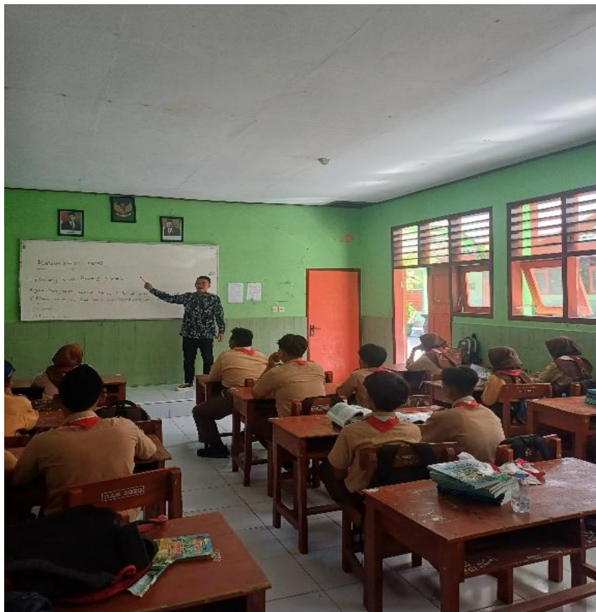
Gambar 2. Implementasi pembelajaran Menggunakan Media Kartu Pintar di kelas VIII B dan VIII C SMPN 2 Geger Madiun