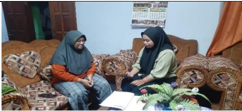
Wawancara pemilih pemula