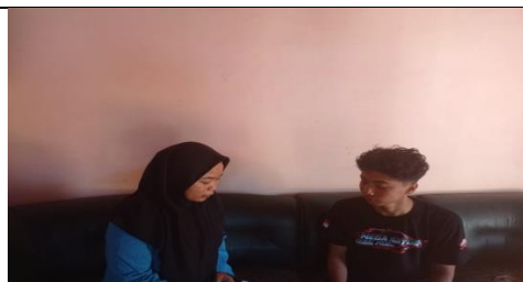
Wawancara pemilih pemula