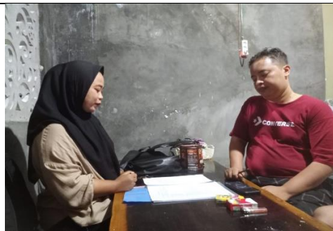
wawancara dengan KPU Divisi sosialisasi Pendidikan pemilih, Partisipasi Masyarakat (sosdiklih parmas)