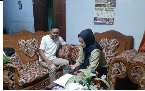
Wawancara pemilih pemula