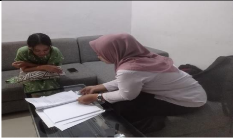
Wawancara pemilih pemula