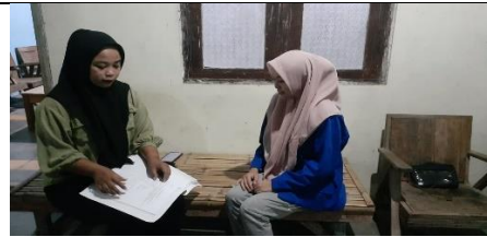
Wawancara pemilih pemula