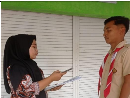
Wawancara pemilih pemula