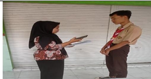
Wawancara pemilih pemula