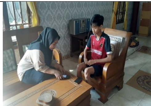
Wawancara pemilih pemula