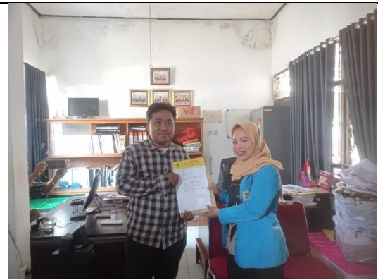
penyerahan Surat Perizinan kepada KPU