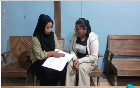
Wawancara pemilih pemula