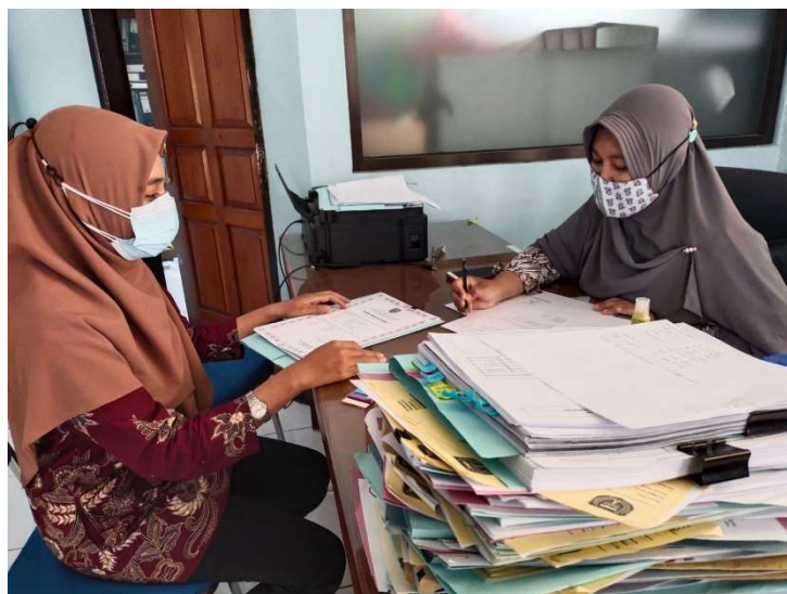
Foto Bimbingan dengan Sub Bagian Perencanaan