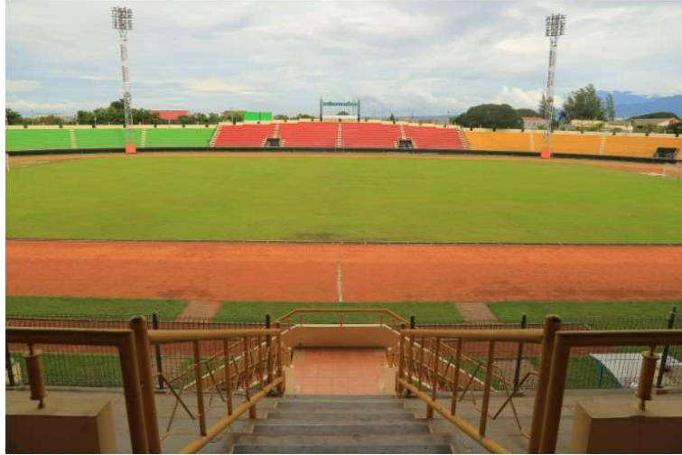
Foto Stadion Wilis